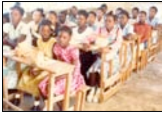
School "Desprez" van Port-au-Prince