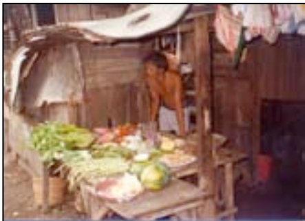
Mini project : groenten verkoop