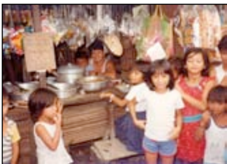
Mini project : verkoop van voorbereide schotels

Het doel van « Free clinic » is drievoudig :