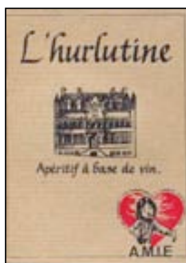
Aperitief « A.M.I.E. »