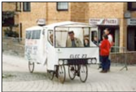
« 24u fiets » in Louvain-la-Neuve