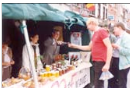
Stand van de « Hurlus » in Moeskroen