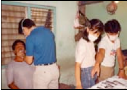
Free clinic : tandarts aan het werk.