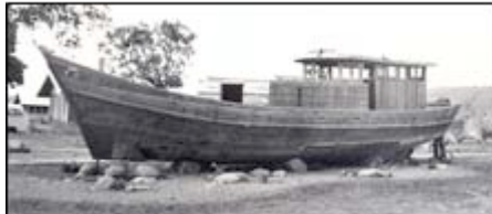
Boat people (tentoonstelling in het kamp van Bataan, Filippijnen)