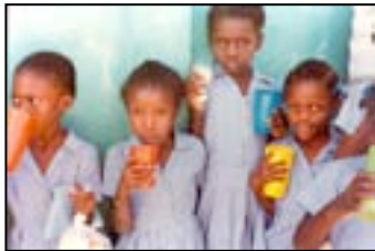
Ontbijt in Desprez