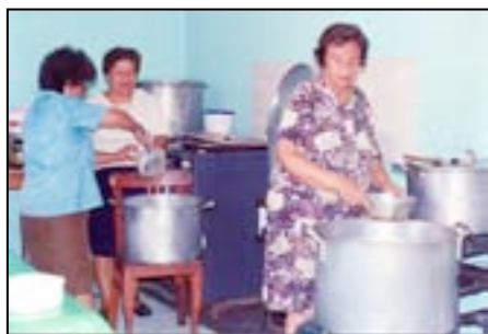
Volkskeuken in Breña (Lima)