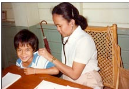
« Free clinic » : medische zorgen